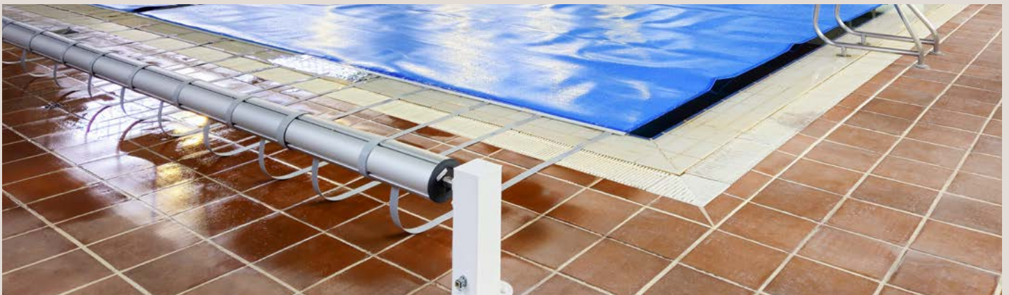
COBERTOR MOUSSE PE 5 mm 25 x 12,5 con ENROLLADOR FIJO EMPALMADO motorizado | PISCINA MUNICIPAL SOTRONDIO COBERTURA EM ESPUMA PE 5 mm 25 x 12,5 com ENROLADOR FIXO EMENDADO motorizado | PISCINA MUNICIPAL SOTRONDIO