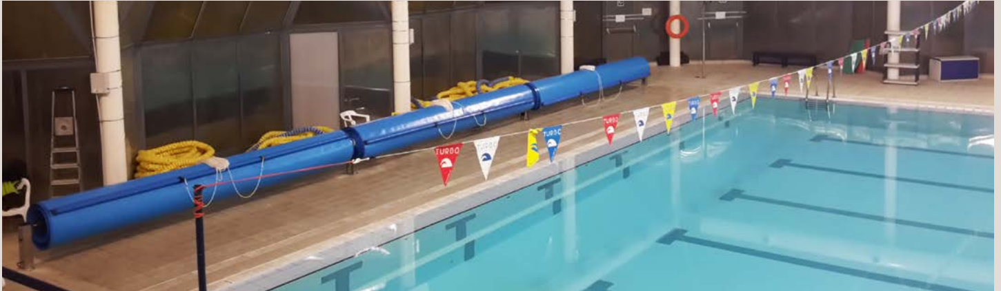
COBERTOR MOUSSE PE 5 mm 50 x 16,62 con ENROLLADOR FIJO EMPALMADO motorizado | UNIVERSITAT POLITÈCNICA DE VALÈNCIA COBERTURA EM ESPUMA PE 5 mm 50 x 16,62 com ENROLADOR FIXO EMENDADO motorizado | UNIVERSITAT POLITÈCNICA DE VALÈNCIA