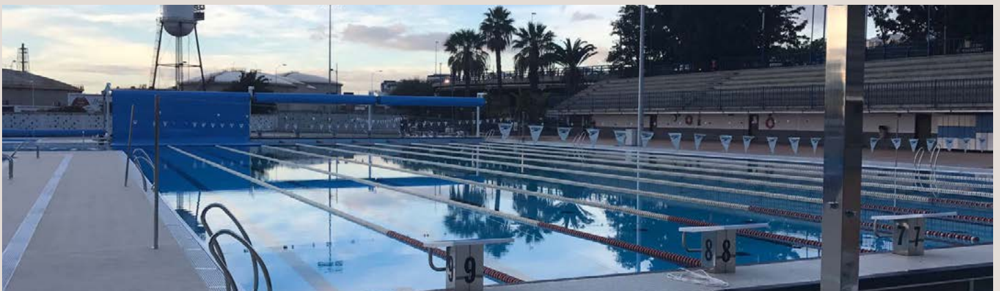
COBERTOR MOUSSE PE 5 mm 50 x 33 con ENROLLADOR FIJO CON PIES ELEVADOS motorizado PISCINA MUNICIPAL ACIDALIO LORENZO (TENERIFE) COBERTURA EM ESPUMA PE 5 mm 50 x 33 com ENROLADOR FIXO COM PÉS ELEVADOS motorizado PISCINA MUNICIPAL ACIDALIO LORENZO (TENERIFE)