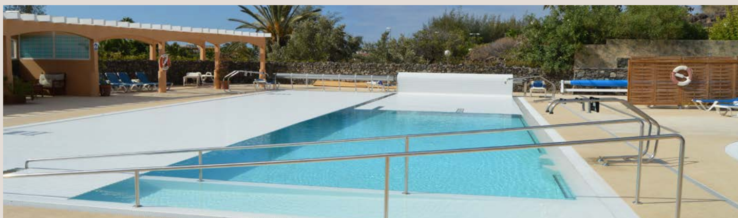
CUBIERTA AUTOMÁTICA DE LAMAS DE PVC 25 x 12.50 | CENTRO SVENKA (GRAN CANARIA)

COBERTURA EM ESPUMA PE 5 mm 50 x 21 com ENROLADOR MON-12 móvel motorizado COMPLEXO AQUÁTICO E DESPORTIVO CAN MERCADER (CORNELLÁ)