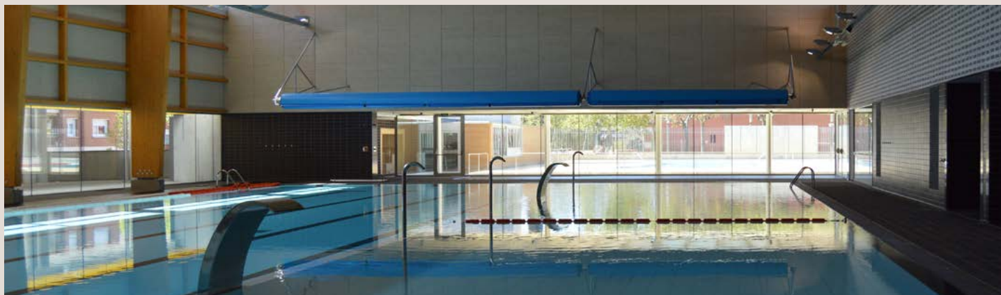
COBERTOR MOUSSE 5 mm 25 x 16,50 con ENROLLADOR FIJO CON ESTRUCTURA A PARED motorizado PISCINA MUNICIPAL TORRE ROJA VILADECANS

COBERTURA EM ESPUMA PE 5 mm 25 x 16,50 com ENROLADOR FIXO COM ESTRUTURA À PAREDE motorizado PISCINA MUNICIPAL TORRE ROJA VILADECANS