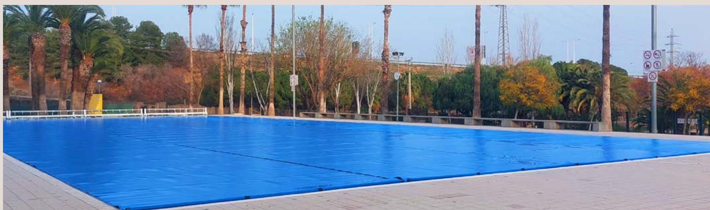
COBERTOR MOUSSE PE 5 mm 50 x 21 con ENROLLADOR MON-12 móvil motorizado COMPLEX AQUATIC I ESPORTIU CAN MERCADER (CORNELLÁ)

COBERTURA EM ESPUMA PE 5 mm 25 x 16,50 com ENROLADOR FIXO COM ESTRUTURA À PAREDE motorizado PISCINA MUNICIPAL TORRE ROJA VILADECANS